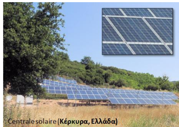
Centrale solaire (Κέρκυρα, Ελλάδα)

Une cellule photovoltaïque est un composant électronique qui, exposé à la lumière (photons), produit de l'électricité grâce à l'effet photovoltaïque qui est à l'origine du phénomène. La tension obtenue est fonction de la lumière incidente. La cellule photovoltaïque délivre une tension continue.