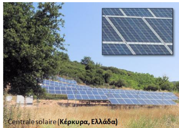
Centrale solaire (Κέρκυρα, Ελλάδα)

Une cellule photovoltaïque est un composant électronique qui, exposé à la lumière (photons), produit de l'électricité grâce à l'effet photovoltaïque qui est à l'origine du phénomène. La tension obtenue est fonction de la lumière incidente. La cellule photovoltaïque délivre une tension continue.